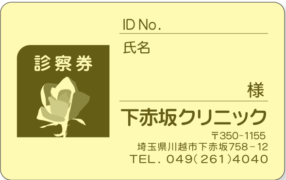
S-708 (クリーム紙印刷イメージ)