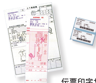
伝票印字サンプル

各種、検査伝票の処理に使用します。 検体ラベルを同時発行 (LP-2200 使用時)